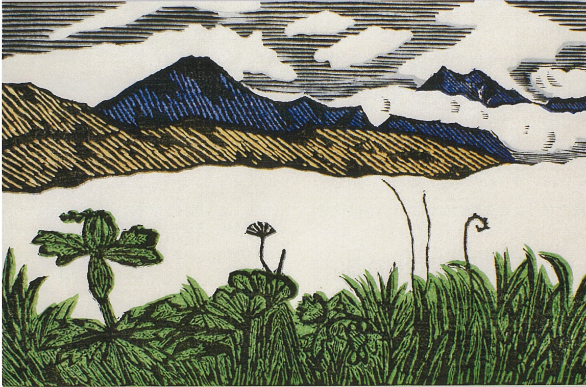
川上澄生《渚辺の草原》1966（昭和41）年『アラスカ物語』（1966年）挿画 [I期展示]