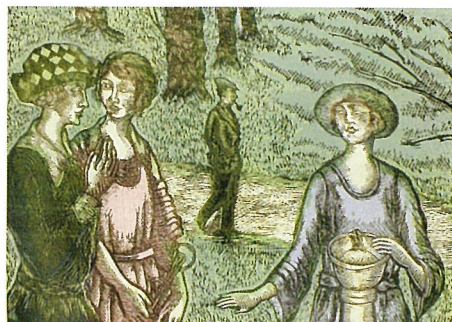
川上澄生《異国春光》1924 (大正13)年 [I期展示]

本展では、文明開化の時代の都市や横浜をモチーフにした作品を展観し、川上澄生が描いた郷愁の都市の姿をご覧ください。