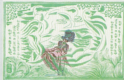
川上澄生《初夏の風》1926 (大正15)年

会期 | 4月11日 [土] - 5月24日 [日] 棟方志功が版画家となるきっかけとなった川上澄生の代表作。