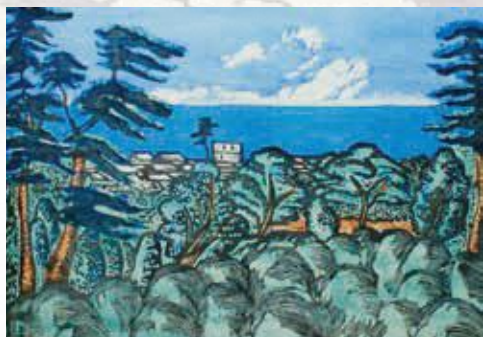
川上澄生《海の見える風景》 1926(大正15)年 木版多色刷 紙