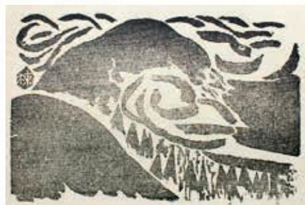
棟方志功《夏泊・夏の山》1932(昭和7)年 木版墨刷 紙 『版藝術』第1年第3号(1933年)