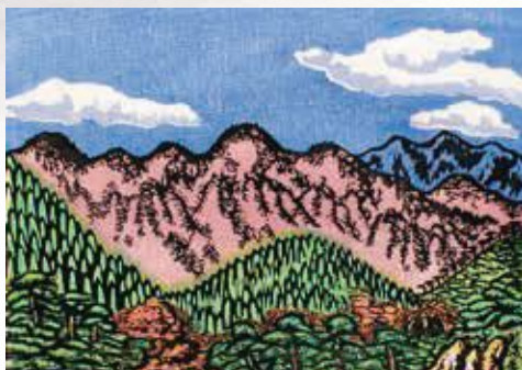
川上澄生《野州大谷秋景》 1929(昭和4)年 木版多色刷 紙