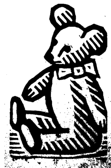
上記挿画は、『北海道絵本』〔1949 (昭和24) 年 日本交通公社刊〕に掲載された川上澄生の挿画です。