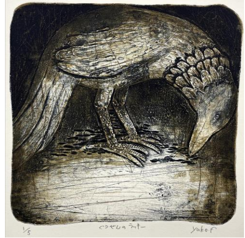
スポンサー賞(晃南印刷賞) 《ぐうぜんのラッキー》 フジタ ユウコ (東京都、岡山県出身)