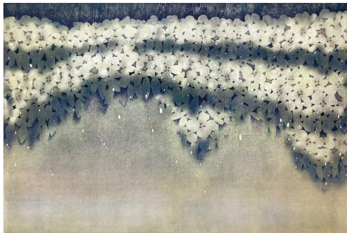
スポンサー賞(マツヤ賞) 《all at once-2》 おかだ いくみ 岡田 育美 (東京都、千葉県出身)