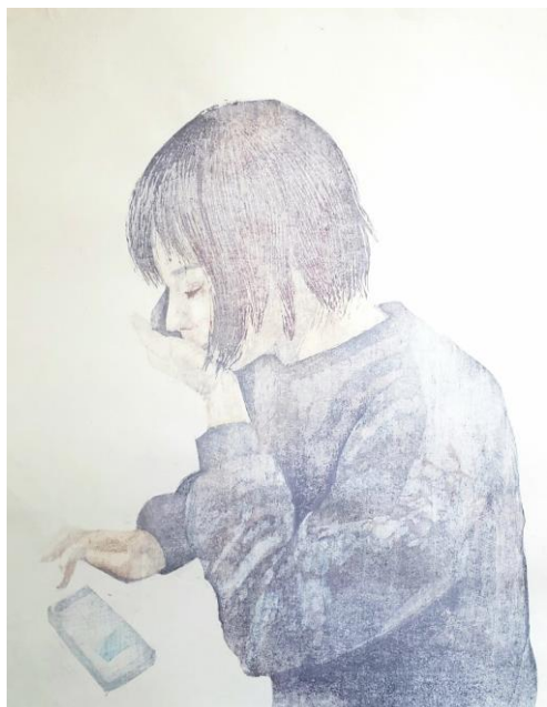
《やばい。推しが出た。》